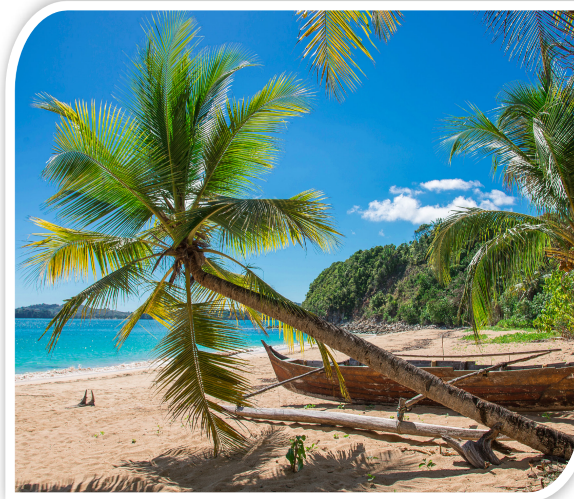
Bon 10.000 zł na wakacje na Madagaskar

WAKACJE.nr dowodu zakupu.Twoja odpowiedź